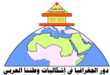
دور الجغرافيا في إشكاليات وطننا العربي

إجراء بعض التعديلات خلال موعد أقصاه ٣١ ديسمبر ٢٠١٦م الموافق ٢ ربيع الآخر ١٤٣٨ هـ.