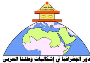
دور الجغرافيا في إشكاليات وطننا العربي

تنظم إدارة المؤتمر رحلة علمية لمنخفضي الفيوم ووادي الريان بالصحراء الغربية. في يوم الخميس ٩ مارس ٢٠١٧ الموافق ١١ جمادى الآخر ١٤٣٨ هـ، وعلى من يرغب في حضور الرحلة ملء استمارة الاشتراك في اليوم الأول للمؤتمر، وتسديد مبلغ ٣٠٠ جنية مصري أو ما يقابلها بالدولار الأمريكي. (يوجد تخفيض لطلبة الجامعات المصرية)